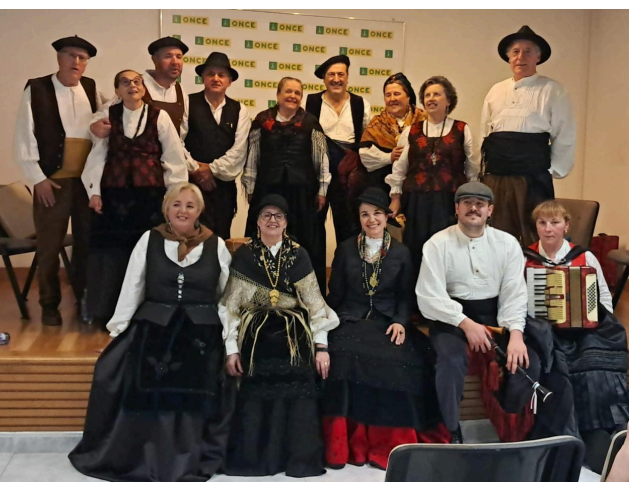
Grupo Charamuscas de música tradicional