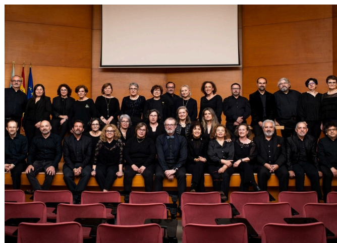
Coro Harmonía Stellae